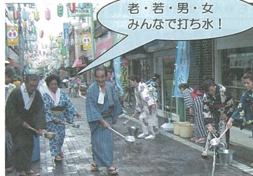
7月30日 共栄商店街盆おどり