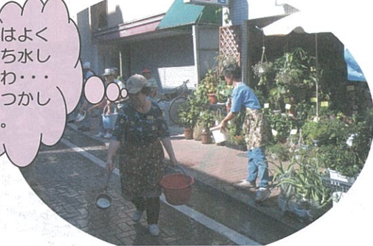
8月11日 道の日イベント 8月20日 小松川・平井地区