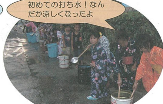
7月30日 一之江町会盆おどり