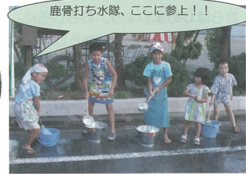
8月20日 鹿骨2丁目町会