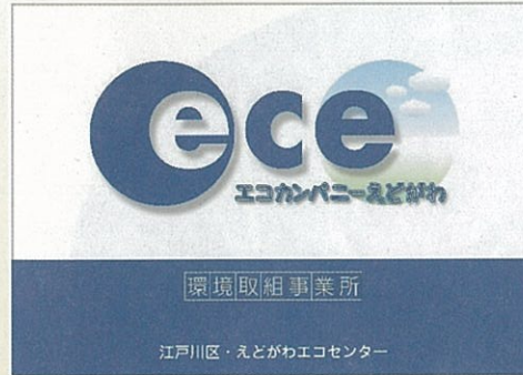
エコカンパニーえどがわ表示板