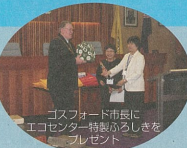
ゴスフォード市長にエコセンター特製ふるしきをプレゼント