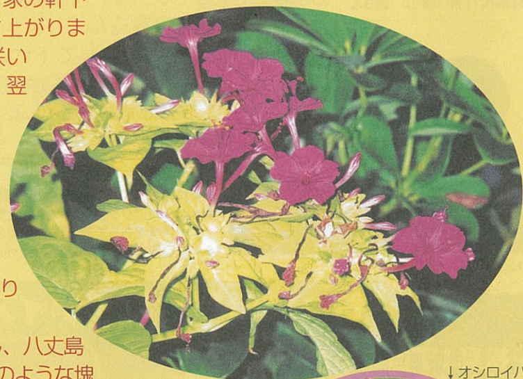
↓オシロイバナの種

オシロイバナは強く、種子をまくと必ず発芽し、八丈島では冬でも咲きます。根は黒く小さなサツマイモのような塊です。夜、車のライトや外灯にあたった姿はつややかで、美しいものです。秋の夕ぐれ、いろいろなことを考えながら目と鼻で、フォーオクロックを探してみませんか。