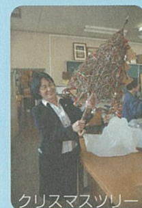
クリスマスツリー