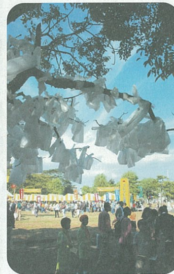
*不燃物として捨てられたものの枚数

「区民まつり」でのエコセンター・ブースは「区民1人が1年間に捨てているレジ袋240枚*」を枝に結びつけた、オブジェが目印。見た方からは「もったいない!」「マイバッグを使っています」との感想をいただきました。