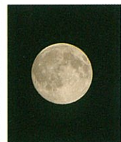
雲間からのぞいた名月

※家庭で電気をたくさん使う家電は、大きいものから、エアコン(25.2%)、冷蔵庫(16.1%)、照明器具(16.1%)、テレビ(9.9%)等です。割合が大きいほうが省エネ効果は大きくなります。