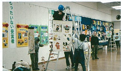
スタッフ活躍中(昨年の区民大会にて)