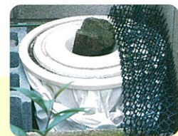
オリジナルのコンポスト