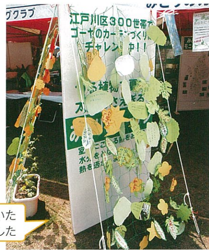
個性豊かなゴーヤの葉・花・実のついた「カーテン」になりました

モニターの意気込みがゴーヤをかたどったカードに乗って、「環境フェア2010」に集まりました。