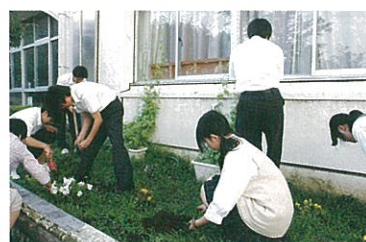
雑草とりに奮闘中

(臨海町/高校クラブ活動)は、部員の発案で様々なボランティアをしています。学校の花壇にゴーヤとあさがおのプランターを仲間入りさせました。