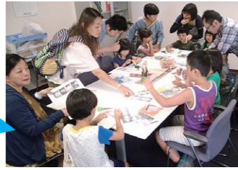
牛乳パックで作る 万華鏡教室