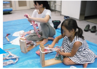
夏休み 親子布ぞうり教室