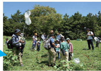
親子のための「昆虫ふれあいウォッチング」

各イベントの詳細や募集については、広報えどがわ等でお知らせします。お問い合わせはえどがわエコセンターまで!