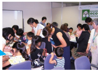
ペットボトルで作る キラキラ風車教室