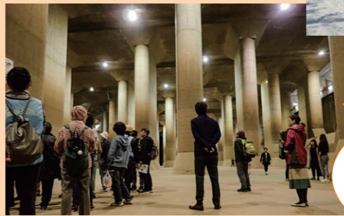
首都圏外郭放水路バス見学会