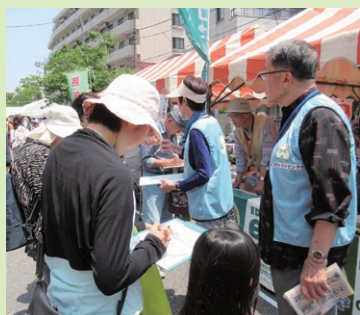
地域まつりでアンケートの実施

6月の「みどりのカーテン」講習会に加え、2月には葛西海浜公園のラムサール条約登録のPRをしました。