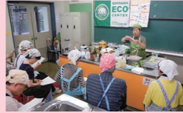
省エネクッキング

区内12ヶ所で17回の講座を開催し、一般家庭のほか、区内小中学校や事業所など約470の方々「みどりのカーテン」づくりに取り組みました。