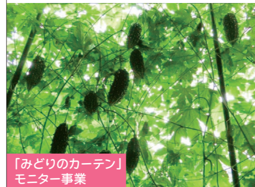
「みどりのカーテン」 モニター事業

エコちゃんねる=えどがわエコセンターのイメージキャラクター・エコちゃん+Channel(情報を送る) 2004年7月創刊