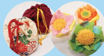
古紙や古布を使うものづくり教室

プラスチックの海洋汚染に取り組むため、学識・行政・企業・NPOの代表を招き、シンポジウムを開催しました。