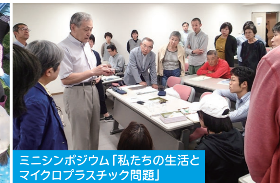
ミニシンポジウム「私たちの生活と マイクロプラスチック問題」