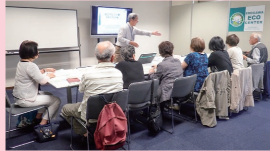
「家庭の省エネ診断サービス」説明会

区内12ヶ所で17回の講座を開催し、一般家庭のほか、区内小中学校や事業所など約470の方々「みどりのカーテン」づくりに取り組みました。