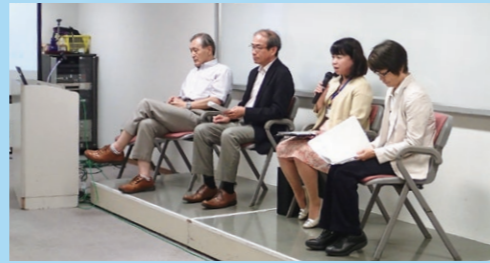
ミニシンポジウム「私たちの生活とマイクロプラスチック問題」