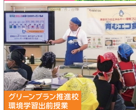
グリーンプラン推進校 環境学習出前授業