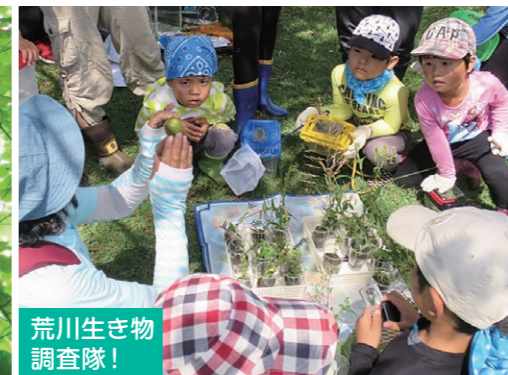
荒川生き物 調査隊!