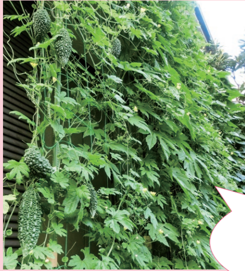
「みどりのカーテン」モニター事業