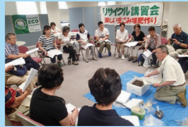
発泡スチロール箱で「生ごみ堆肥づくり」