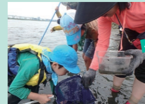
荒川でカニさがし&魚とり