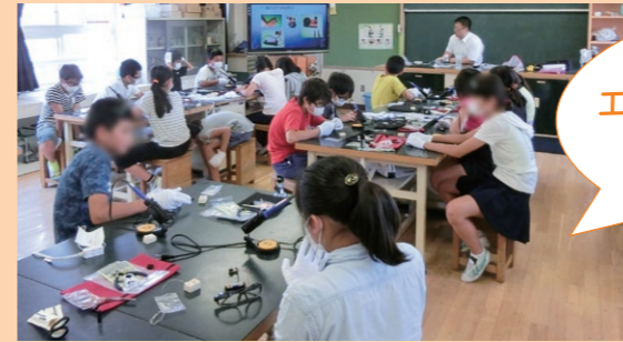
篠崎第二小学校6年生 出前授業「燃料電池って何だろう?」