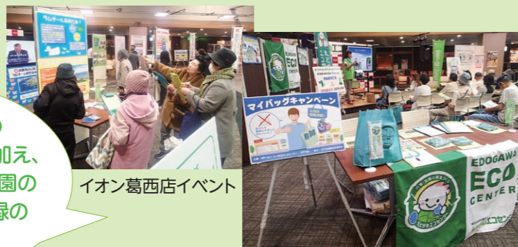
イオン葛西店イベント

6月の「みどりのカーテン」講習会に加え、2月には葛西海浜公園のラムサール条約登録のPRをしました。